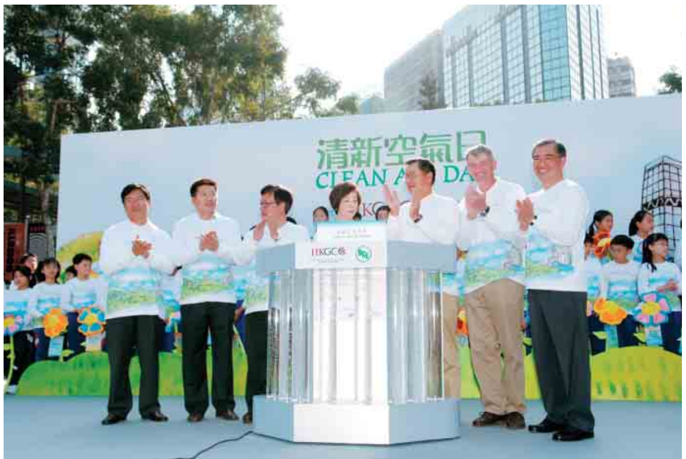
▲商界組織「清新空氣日」，鼓勵市民保護空氣質素。

耗，從而減低廢氣排放，當中還包括一些政府和民間組織一直推行的良好守則，例如是多步行、彈性上班時間和停車熄匙等。