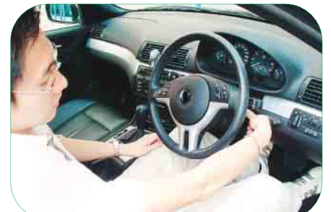
▲響應環保呼籲，停車熄匙。