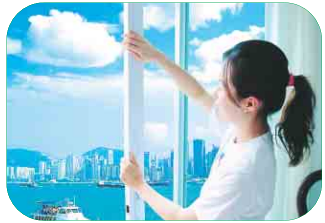
▲充分利用天然光線和自然風，減少因能源消耗所排放的廢氣。